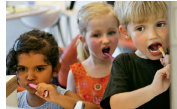
Lebenslange Mundhygiene zahlt sich aus: Auch kleine Patienten werden hier bestens betreut.

Im Bereich Implantologie, einem der besonderen Spezialgebiete des ZahnMedizinischenTeams am Aegi, werden sowohl bewährte moderne Standardverfahren, als auch computergestützte Verfahren angewandt. Welche Methode im Individualfall die richtige ist, wird nach der Diagnose sorgfältig festgelegt. Für Patienten, deren Kieferknochen einem Implantat nicht genügend Halt bieten kann, setzt das ZahnMedizinischeTeam